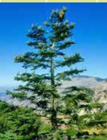
Abies nebrodensis of Siciliaanse zilverspar

Abies : de naalden zitten netjes geordend aan de tak van de zilverspar en de naaldvoetjes zijn rond. Kijk maar bij deze Abies nebrodensis . Elke naald staat afzonderlijk op de tak. Als er kegels zichtbaar zijn: die staan recht op de tak. Als u nu met de rug naar deze boom gaat staan, ziet u rechts ( Pinus strobus ) en tegenover u een boom ( Pinus