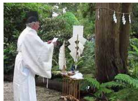
Shintomaster Paul de Leeuw

Deze rododendron is afkomstig van het Japanse eiland Yakushima en groeit daar in de cederbossen (= Cryptomeria japonica ) en op de